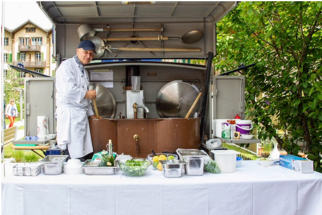
... die Risotto-Station.