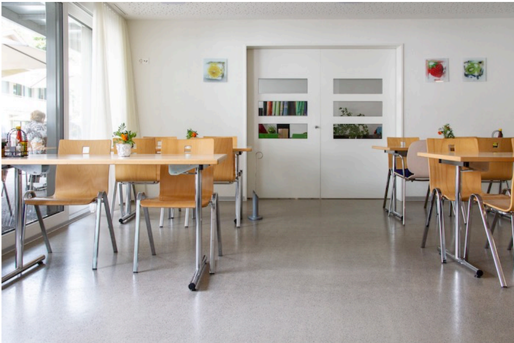
Drinnen gibt es genug Platz, um zusammen zu sein.