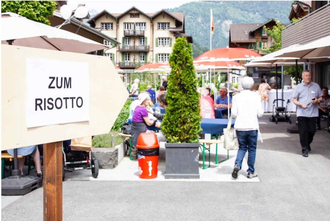
Zur Mittagszeit ein beliebter Zwischenstopp ...