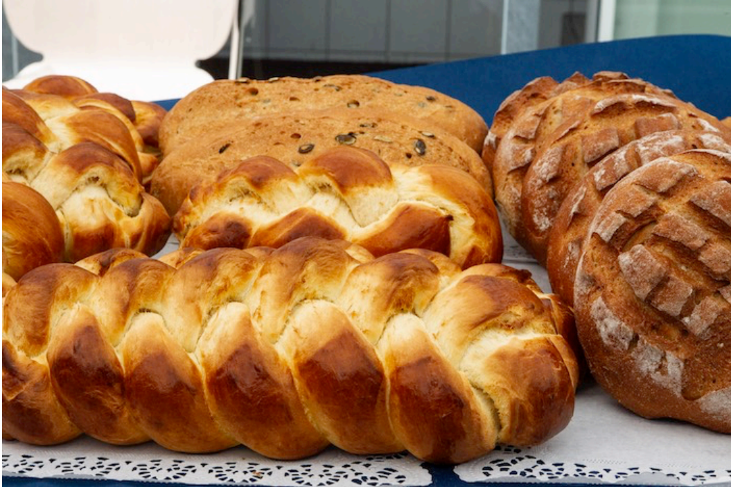
Neben frisch gebackenem Brot ...