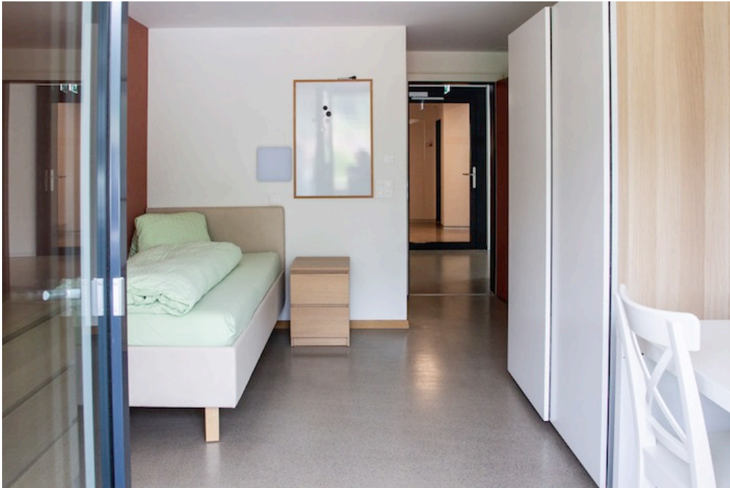
Modern und hell sind die 15 Zimmer des Hauses «Eiche».