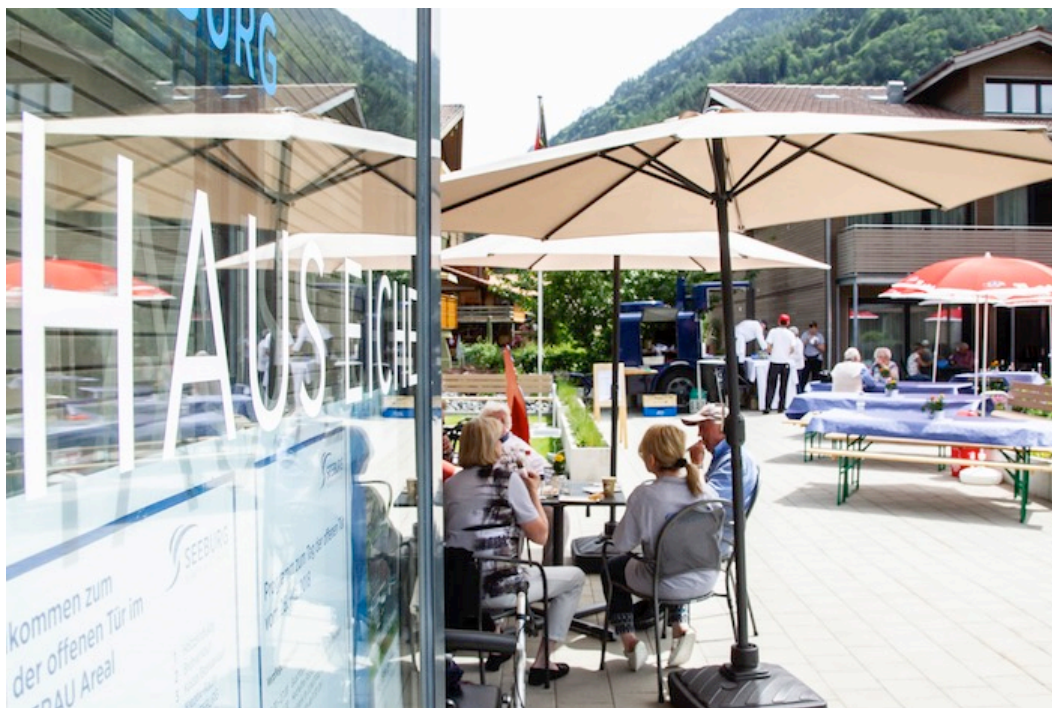
Das erste und einzige Alters- und Pflegeheim von Wilderswil öffnete am Samstag seine Türen.