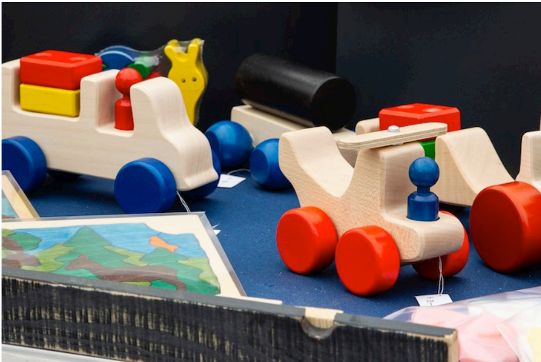
... gab es Spielzeug aus Schweizer Holz zu kaufen.